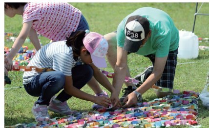
過去の選定事業 「天まで届け!かわさき色輪っかつなぎ」

都市イメージの向上、川崎への愛着や誇りにつながる事業・イベントなどを募集します。テーマ部門(かわさきパラムーブメントに関連した事業・イベント)と自由部門。対象…4月1日～31年2月28日に、個人・事業者・団体などが新たに行う(既存事業の場合は新たな展開を伴う)事業。支援内容…事業の直接経費の2分の1(限度額50万円)を助成。事業の広報支援など。申 問 1月26日までに申請書と必要書類を直接、総務企画局シティプロモーション推進室 ☎200-0848 FAX200-3915。[選考]。*募集案内は区役所、市民館などで配布中。申請書は市HPからダウンロードできます。