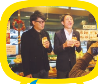
吉本芸人の「囲碁将棋」が美食!

川崎市宮前区の「見たい・知りたい・行ってみたい!」をあなたに代わって調査する「ぐるっとみやまえTV」。