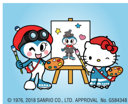
© 1976, 2018 SANRIO CO., LTD. APPROVAL No. G584348

記念して、テーマに沿ったノルフィンの衣装デザインを募集します。応募作品の一部はバスに掲示され、入賞作品は新しいコラボラッピングバスや車内ポスターのデザインに採用されます。☎4月11日(必着)までにチラシにある専用ハガキで交通局管理課☎200-2491 FAX 200-3946。[選考]。※チラシは4月10日から市バス営業所・乗車券発売所、区役所などで配布。