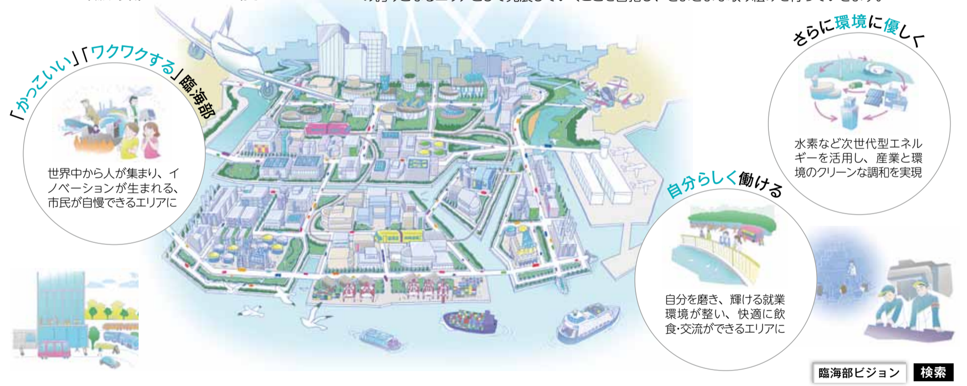
臨海部ビジョン 検索

30年後の将来像として「臨海部ビジョン」を策定しました。人・モノ・情報が高度に融合し、知性と創造性にあふれる地域として輝き続けること。また、快適な就業環境・住環境が整い、市民や働く人の誇りとなるエリアとして発展していくことを目指し、さまざまな取り組みを行っていきます。