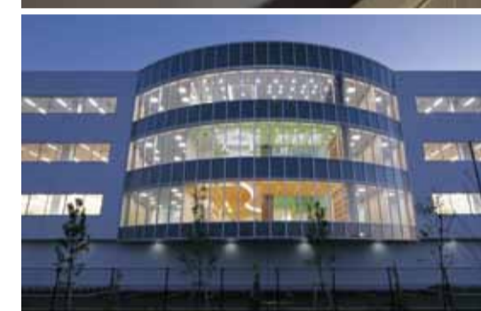
iCONMでは産学官の垣根を越えた研究が行われている