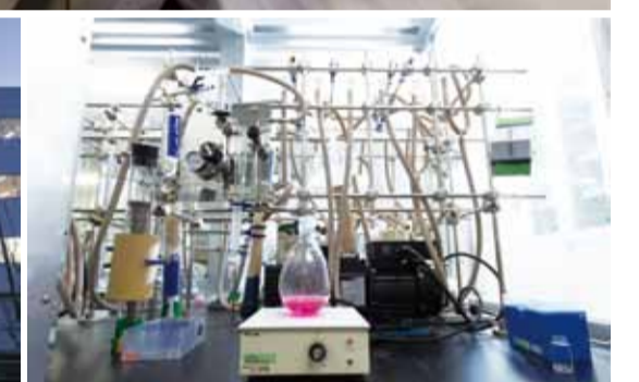
ナノマシンを作るためのさまざまな機械が並ぶ