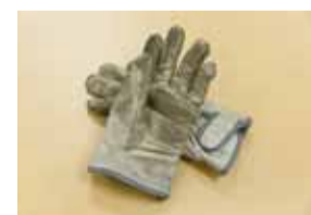
使い込まれた手袋は現場主義の証し