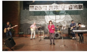
昨年度のバンド部門

対象 ①~③の条件を全て満たすグループ ①区内在住、在学、在勤、区内で活動している人を含む3人以上 ②全3回(8月25日、10月27日、当日終演後)の参加グループミーティングに出席できる ③当日の運営に協力できる 申 6月29日(必着)までに参加申込書(区役所、出張所、市民館などで配布している他、区HPでもダウンロードできます)を直接、郵送、FAXで〒213-8570高津区役所地域振興課 ☎861-3133 FAX861-3103。[選考]