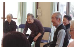
楽しいおしゃべりタイム

「歩いて通える距離に通い場がない!」という声から“そよかぜクラブ”が発足して5年。毎回、パンジー体操と脳トレで体と頭を使った後は、一番のお楽しみのおしゃべりタイム。たまには散歩に出かけることも。近所の公園でも、仲間と行くと旅行に行った気分になります。