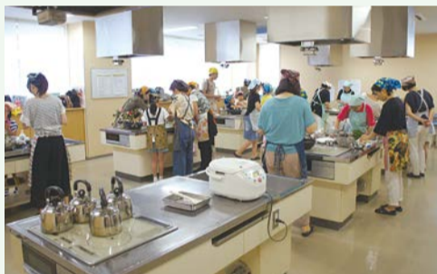
チョークアートや料理教室なども体験できます!