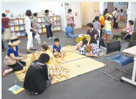
ペーゴマや積み木など昔ながらの遊びも体験できます!

区民交流センター「なかはらっぴ」に集まる市民活動団体の活動内容を楽しみながら知ることができます。体験教室や景品がもらえるスタンプラリーなど、家族みんなで楽しめる企画が盛りだくさんです。また、中原区役所コンサートも同時開催します。※一部事前予約 日時 7月15日(日)10時～16時 場所 中原市民館 問 区役所地域振興課 ☎744-3324 FAX744-3346