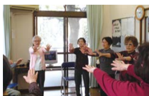
パンジー体操の様子

また、年に3回パンジー体操を普及しているボランティアのパンジー隊に来てもらい、続けていく元気をもらっています。参加を希望する人は、事前にお問い合わせください。