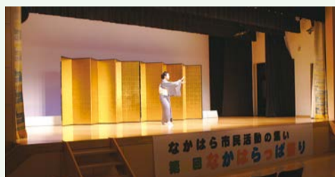
ホールではコンサートや日本舞踊など催し物も多数実施!