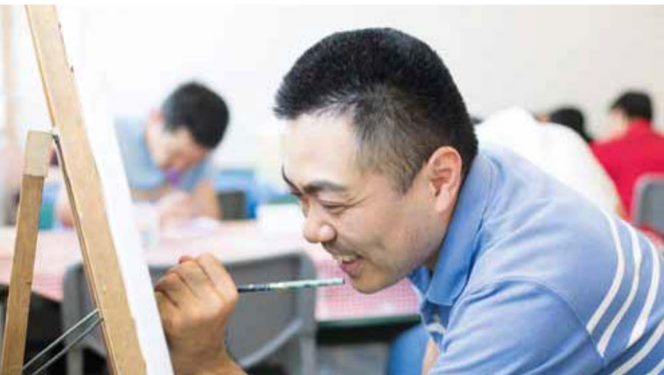
半澤 真人 HANZAWA MASATO 細かい描写と大胆な構図で、川崎の工場風景を独自にアレンジし、新たな造形物として再構築している。