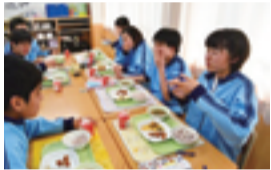
● 中学校完全給食全校実施に向けた取り組み

市総合計画に基づき、以下の事業について特に重点的に取り組み「安心のふるさとづくり」や「力強い産業都市づくり」を推進しました。