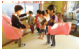
● 保育受け入れ枠を拡大し待機児童対策を継続的に推進