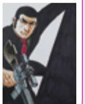
SPコミックス96巻 表紙 ©さいとう・たかを

初公開の貴重な原画をはじめ、ゴルゴの愛用品やお宝シーンなども紹介。 9月22日～11月30日 一般1,200円、65歳以上と高校・大学生1,000円