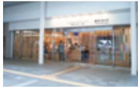
● JR川崎駅北口自由通路の整備