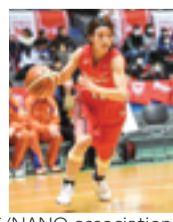
FUJITSU SPORTS/NANO association

10月28日(日)14時試合開始 とどろぎアリーナ 100組200人 9月28日(消印有効)までに往復ハガキか市HPで 210-8577 市民文化局市民スポーツ室 200-2257 FAX200-3599。[抽選]