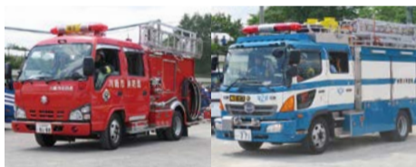
消防・警察車両などの展示

この他、仮設トイレ組み立て、炊き出し試食体験コーナー、ペット同行避難訓練、災害時口腔衛生の講習など。