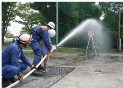
消火訓練(ホースキット)