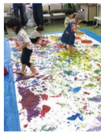
絵の具で自由に遊ぶコーナー