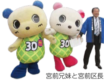
宮前兄妹と宮前区長