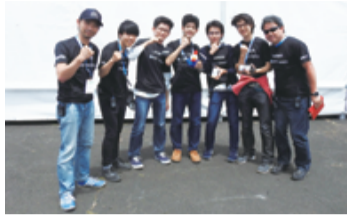
文化賞(教育) 法政大学第二高等学校 物理部 26・28・29年、缶サット甲子園優勝