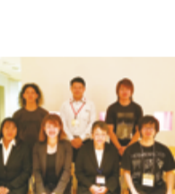
アゼリア輝賞(文化活動) カワサキミュージック キャスト 音楽イベント企画・制作