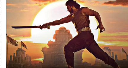
「バーバリ王の凱旋 完全版」

市民が作る、映画のお祭りです。一部、副音声ガイド付き。主な上映作「タクシー運転手～約束は海を越えて～」[「モリ」のいる場所]「バーバリ王の凱旋 完全版」他。 ◎10月28日(日)、30日(火)～11月4日(日) 会場 アートセンター 料金 前売り1,000円(10月7日からアートセンターなどで販売)、当日1,300円。一部プログラムにより料金が異なります 会場 KAWASAKIアーツ・映画祭事務局 ☎953-7652(平日11時～17時) FAX953-7685。市民文化局市民文化振興室 ☎200-2416 FAX200-3248 ※詳細は市民館などで配布中のリーフレットか、しんゆり映画祭のHPで。