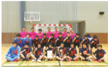
スポーツ賞(実践) 法政大学第二高等学校 ハンドボール部 29年、全国3冠達成