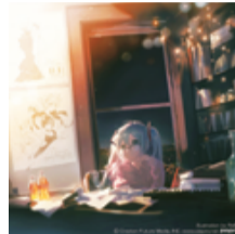
▲初音ミク illustration by Rella ©Crypton Future Media,INC. www.piapro.net