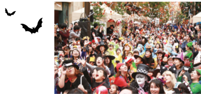
キッズパレードは27日(出)

28日(日)には国内最大級の仮装パレードが実施されるなど、期間中は川崎駅周辺で、さまざまなイベントが行われます。詳細はプロジェクトのHPをご覧ください。