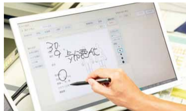
専用フォーマットは手書きだからこそ素早い処理が可能に ※写真はイメージ

「建物は一戸建てですか？」 「そうです」 「あなたのお名前と電話番号を教えてください」 「〇〇〇〇です」