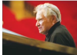
▲デイヴ・グルーシン