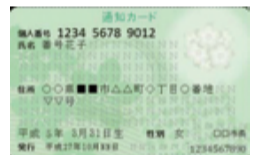
個人番号(マイナンバー)を知らせる紙製の「通知カード」

☎住んでいる区の区役所区民課・支所区民センター 市民文化局戸籍住民サービス課 ☎ 200-2342 FAX 200-3912