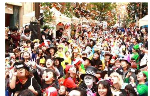
※写真は2016年・2017年の様子