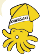
川崎市選挙マスコット「イックン」

統一地方選挙とは、地方自治体の議会議員や首長を選ぶ選挙のうち、一定期間に任期満了となるものを全国的に期日を統一して行う選挙のことをいいます