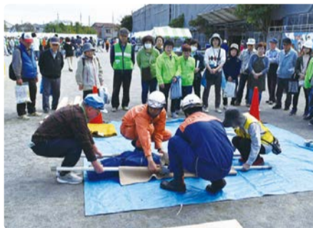
身近な道具を使用した救出・搬送訓練