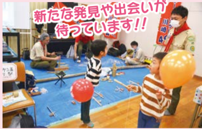
新たな発見や出会いが待っています!!