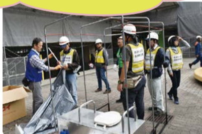
仮設トイレ設置訓練

町内会では困っている人たちと助け合いたいと思っています。ぜひ、地域の訓練にも参加してください。