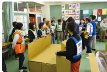
段ボールベッド組み立て訓練