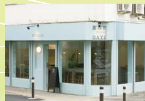
鹿島田駅前のコワーキングカフェでお茶を飲みながら意見交換します

申問 1月15日から直接、電話、FAXで区役所企画課 ☎556-6612 FAX555-3130 [先着順]