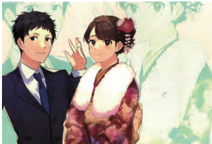
平成31(2019)年成人式ポスター最優秀賞作品

来年1月13日(祝)に開催する「成人の日を祝うつどい(成人式)」の企画を立て運営します。6月上旬～来年2月中旬の平日19時～21時と土・日曜の午前午後全10回程度活動します。活動に参加できる、おおむね16～25歳。5月31日(必着)までに必要事項とメールアドレス(ある場合)、成人式について思うこと(簡潔に)を記入し直接、ハガキ、市HP、メールで〒210-8577 こども未来局青少年支援室 ☎200-2669 FAX200-3931 45sien@city.kawasaki.jp