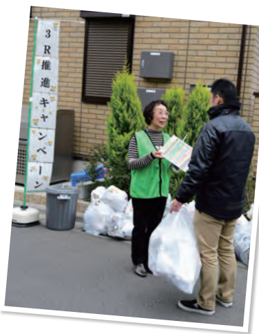
ごみ集積所での活動の様子