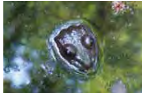
池の中から 宇宙人 ちっぴー(9歳)

豊かな視点を持った写真を数多く残した岡本太郎の精神を引き継ぎ、12歳以下の子どもからの応募作品を展示。大人と異なる視点を楽しめます。◎6月8日～30日