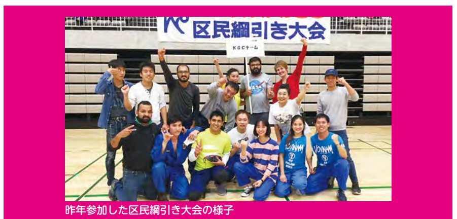
昨年参加した区民綱引き大会の様子