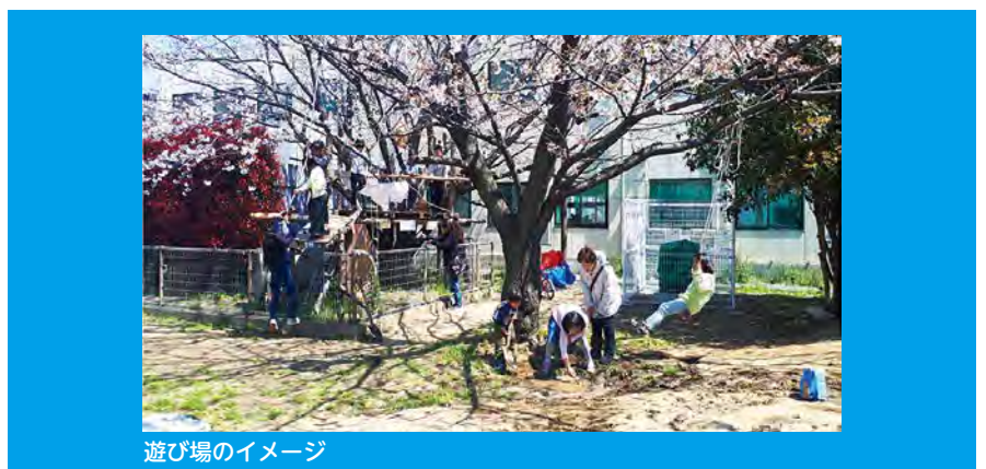
遊び場のイメージ