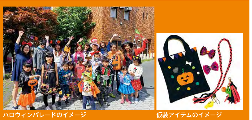
ハロウィンパレードのイメージ