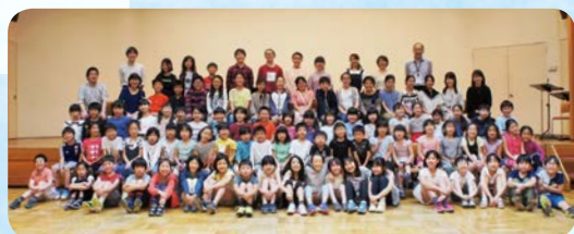
あさお芸術のまち少年少女合唱団2019