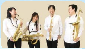
オカピアチエーレ