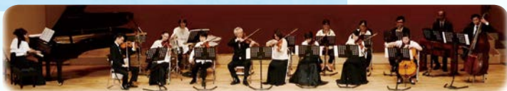
あさお芸術のまち合奏団～あさおの仲間たち～