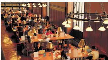
(C) 2017 EX LIBRIS Films LLC - All Rights Reserved

◎今月のおすすめ…『ニューヨーク公共図書館 エクス・リブリス』8月10日～30日。荘厳なボザール様式の建築物である本館と92の分館に、6,000万点のコレクションを誇るニューヨーク公共図書館の舞台裏を、アカデミー名誉賞を受賞した巨匠ワイズマン監督が捉えたドキュメンタリー。誇りと愛情をもって働く司書やボランティアの姿をはじめ、観光客が決して立ち入れない舞台裏の様子を記録し、公共とは何か、民主主義とは何かを浮かび上がらせていく。※日曜最終回、月曜は休映(祝日の場合、翌日に振り替え)。