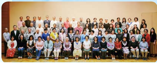
忘れない～明日に向かって Since 3・11合唱団2019