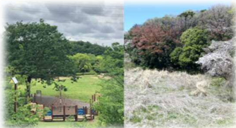
王禅寺ふるさと公園・王禅寺四ツ田緑地