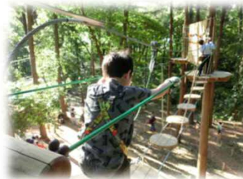
冒険心に満ちた遊び場

□ 自然の特徴を活かした遊び場の創出 次世代の担い手となる子どもたちの情操教育や防災意識の向上、健全な心身の成長につながるような、自然をそのまま活かした自由に遊べるフィールドを創出し、緑地の保全と利活用による適正管理の推進を図るもの。