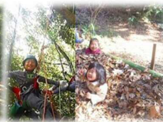
自然を活用した遊び場