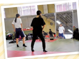
▲鏡を見ながら、振り付けを丁寧にチェック。 教室や卓球場で練習することも

練習では、全身で表現できるように、踊らないで表情だけの練習をすることも。8月の 大会では、チームメイトのおかげで全力を出し切れた。グランプリ決定戦は、先輩たち がつかないでくれたチャンス。新しいメンバーでも精いっぱい頑張りたい」と、感謝の気持ち を胸に、ダンスに磨きをかけています。