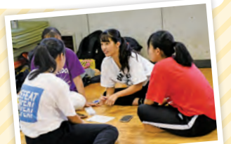
▲アイデアを出し合う姿も真剣