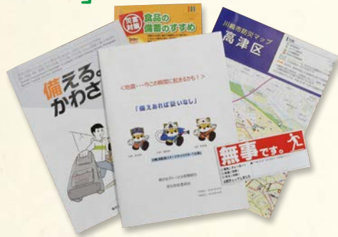
入居者に配布しているマニュアルなど

同マンション敷地内で紙の燃えかすが発見されたことが契機となり、住民の防犯意識が高まりました。防犯カメラの設置や「防災・防犯委員会」設立の取り組みを進め、防災に関する「梶ヶ谷グリーンヒル災害対策本部」を組織化。入居者全員に活動班への参加を呼びかけました。防災マニュアルや安否確認シールと不在連絡届の作成を行い、全戸に配布しました。