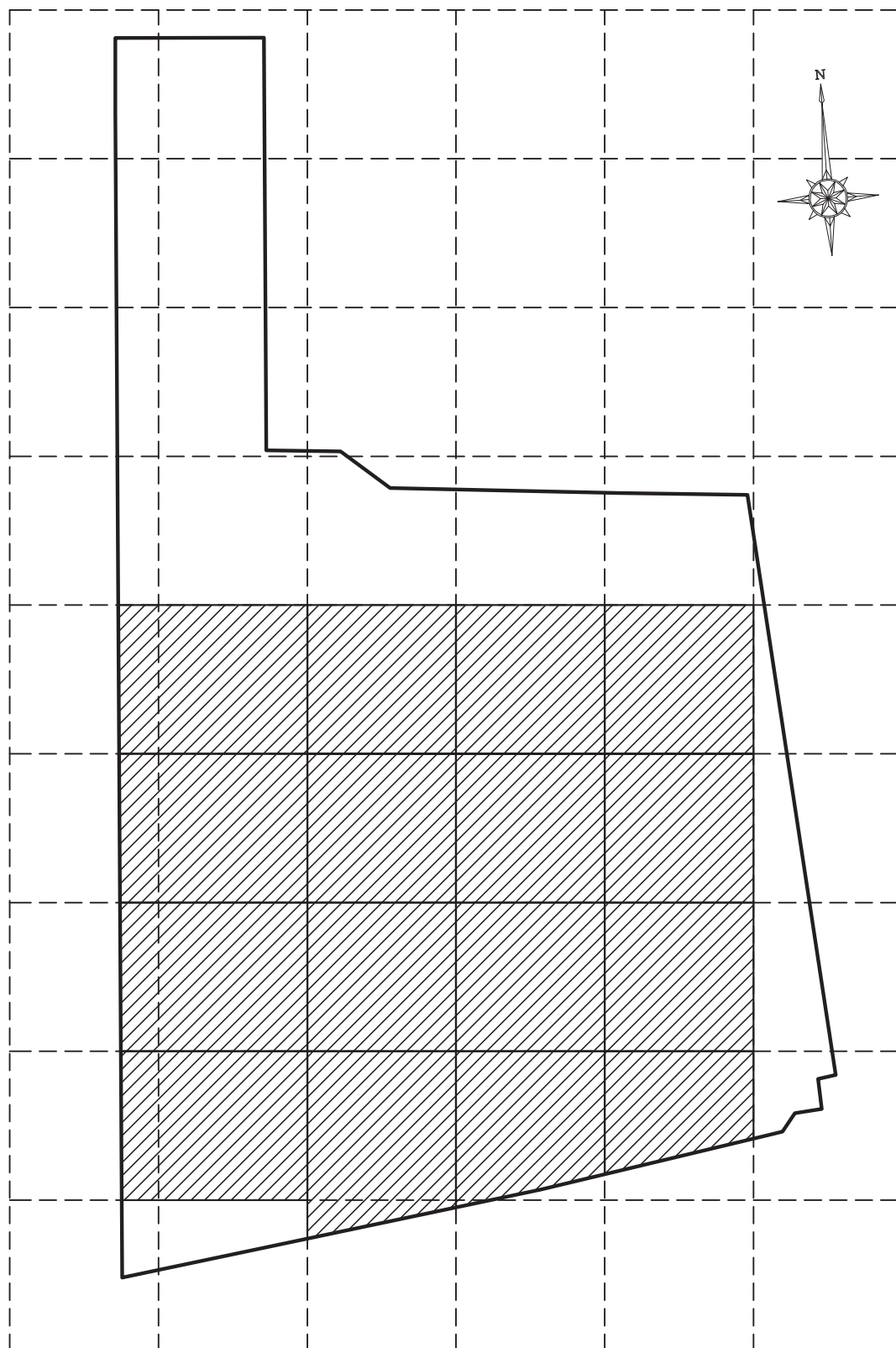
別図 指定を解除する区域