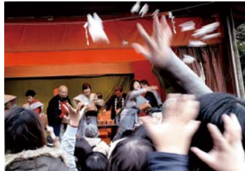
昨年の審査委員長特別賞「福を撒く」