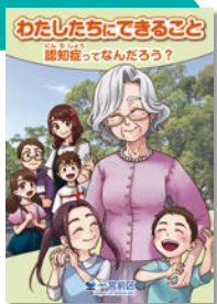
子ども向けの認知症の啓発マンガ