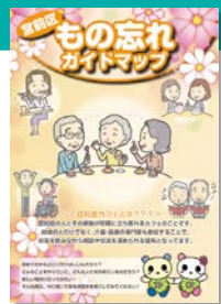
もの忘れガイドマップ