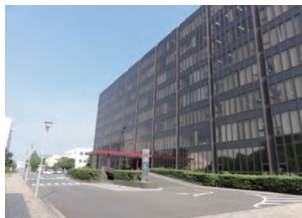
テレビ朝日系「特捜9」などの撮影に使われたTHINK(テクノハブイノベーション川崎)

◎1ロケ地巡りツアー…映画やドラマなどのロケ地をバスで巡ります。◎2月13日(木)10時～17時。