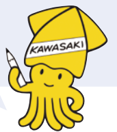
川崎市選挙マスコット「イックン」