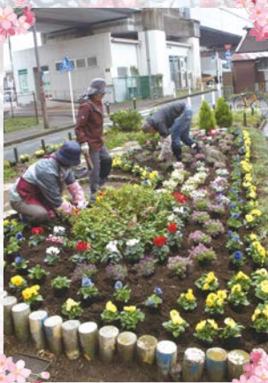
南武線沿い三角公園

毎年5月に季節の花、11月に区の花であるパンジーの植栽を、JR武蔵小杉駅周辺などの花壇で行い、花によるまちのイメージ向上を図っています。さらに、花植え技術向上のための研修会や親子向け花植え体験の実施など、世代を超えた交流の場づくりにも取り組んでいます。花の選定から花壇のデザインまですべてメンバーが行っており、過去には、デザインした花壇が「わがまち花と緑のコンクール」の大賞を受賞したこともあります。