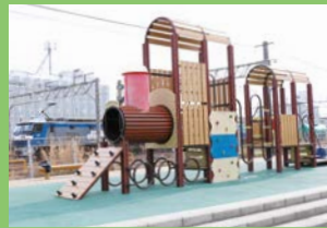
電車の遊具もあります