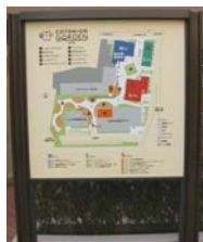
外枠に鉄道レールを用いた看板

多世代交流型まちづくりをテーマに、店舗・賃貸住宅・高齢者サービス施設・保育園などが集まる複合施設として平成30年春にオープンしました。施設内にある小ステージは駅のホームの雰囲気を演出し、施設の案内看板には本物の鉄道レールが使われるなど、鉄道関連のデザインが施されています。コトニアガーデンでは定期的にイベントが開催される他、高齢者サービス施設内には、誰でも利用できる地域交流室もあるので、ぜひ一度足を運んでみてはいかがでしょうか。