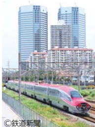
新川崎駅周辺を走る秋田新幹線「こまち」

新川崎駅の横に広がる「新鶴見信号場」は、昭和4年に「新鶴見操車場」として開業しました。当時は東洋一の規模の操車場として、首都圏の物流の根幹を支える重要な施設の一つでした。その後、昭和59年に機能を縮小しましたが、今でも1日150本以上の貨物列車が通る中継地です。また、貨物列車だけでなく、お座敷電車などの団体列車や走直前の新型車両も多く通り、市内でも有数の「撮り鉄」スポットとなっています。新川崎駅周辺を歩くときはぜひ珍しい電車を探してみてください。