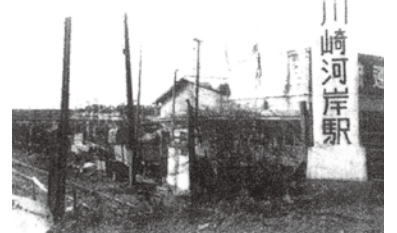
川崎河岸駅の様子

昭和2年、川崎-登戸間の南武線開業に合わせて、矢向-川崎河岸間にも貨物輸送用の支線が開業しました。主に多摩川で採掘された砂利を運ぶための路線で、川崎河岸駅は多摩川のほとり(現在の河原町付近)にありました。当時は重要な貨物線として役割を果たしていましたが、時代が進むにつれ大きな工場が移転し、存在価値が薄れ昭和45年に貨物支線は廃線となりました。現在では、跡地がそのままさいわい緑道となっています。