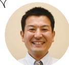
川崎中小企業診断士会 金澤相談員

一人一人の相談内容に応じた制度の案内など、経営上の課題解決を全力でサポートします。お気軽にご相談ください。