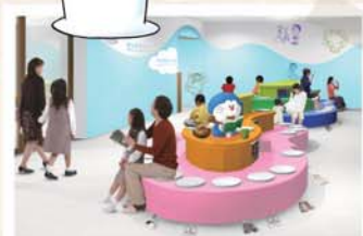
自由にまんがを読める 「まんがコーナー」