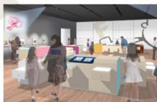
代表作の直筆カラー原画などを 展示する「展示室I」