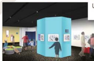
作品をテーマごとに分けて じっくり鑑賞できる「展示室II」