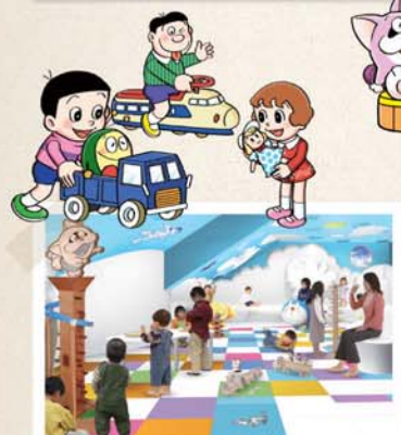
小さな子どもたちが楽しく遊べる 「キッズスペース」