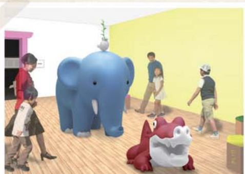
切り絵をもとに作られた動物のオブジェが 出迎える「どうぶつたちの部屋」