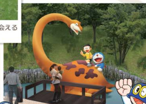
ピー助とのび太たちが待っている 絶好の写真スポット