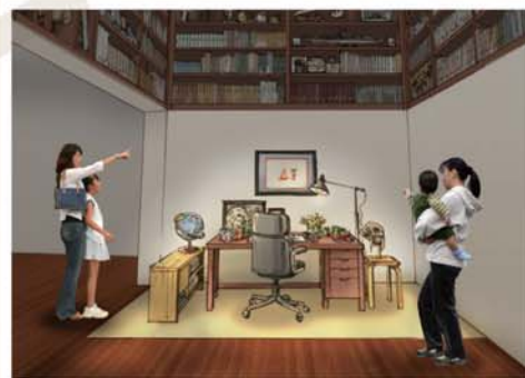
愛用の机と膨大な蔵書・資料本を展示する 「先生の部屋」