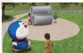
いろんなキャラクターに出会える 「はらっぱ」