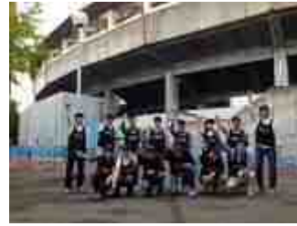
川崎フロンターレホームゲームでの就労体験