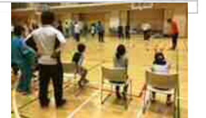
(上) 車椅子バスケットボール体験 (下) ボッチャ体験