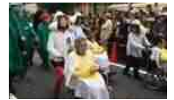
ハロウィン・パレード参加者の様子