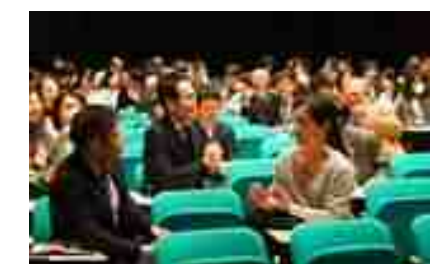
講演会での実践的な研修の様子