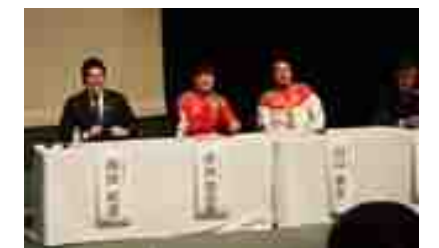
シンポジウムでのパネルディスカッション