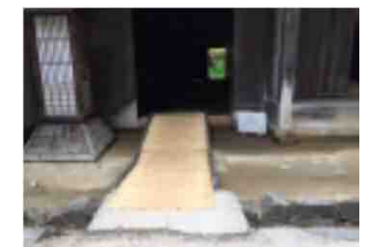
日本民家園での簡易スロープ