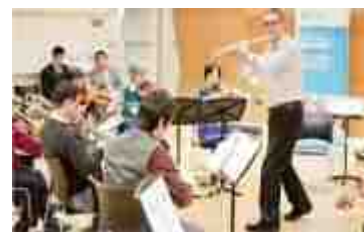
ミュージックワークショップの様子