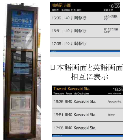
日本語画面と英語画面が相互に表示