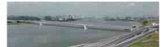
橋りょうイメージ図