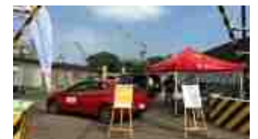
KIS認証製品の屋外展示