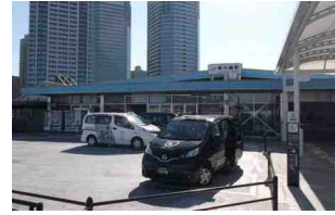
JR新川崎駅のUDタクシー乗り場