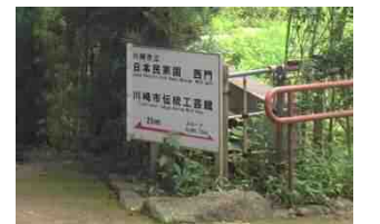
生田緑地内の看板(方向、スロープの標記がある事例)