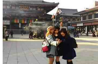
市の魅力のPR(川崎大師)