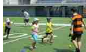
「誰でもスポーツ広場」の様子