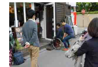
店舗調査のイメージ