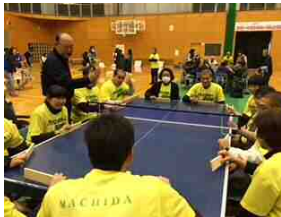
みんなで楽しめる卓球パレー