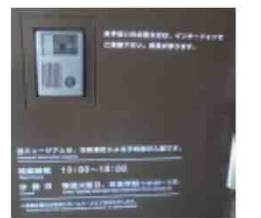
藤子・F・不二雄ミュージアムの手伝いが必要な方向へのインターホン