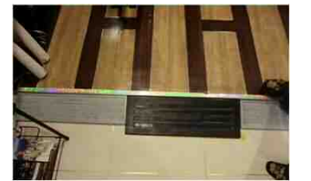
宿泊施設における段差解消ブロックによる段差解消事例