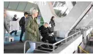
とどろきアリーナ、等々力陸上競技場でのアクセス・オーディットの様子