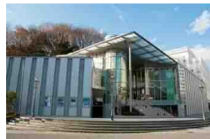
アートセンター外観