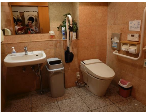
→ 作成・配布したマップ(A4)