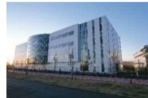
ナノ医療イノベーションセンター（iCONM）