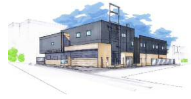
宿河原出張所 完成イメージ