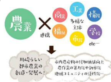
農業と多様な主体との連携イメージ