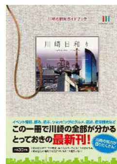
「川崎市観光ガイドブック 川崎日和り」