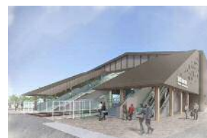
JR南武線稲田堤駅 完成イメージ