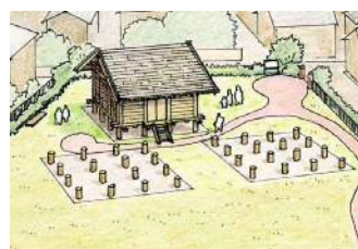
橋樹官衙遺跡群整備イメージ (保存活用計画)