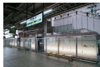
再生可能エネルギーと水素を用いた自立型エネルギー供給システムの導入事例（JR南武線武蔵溝ノ口駅）