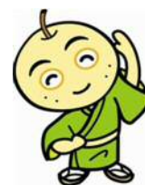
介護予防いきいき大作戦 マスコットキャラクター「長寿郎」