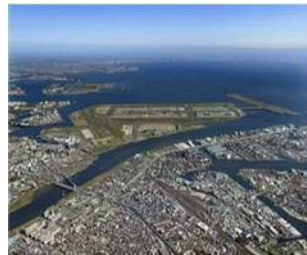
空から見た川崎臨海部と羽田空港