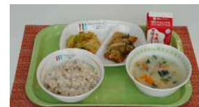
(株)タニタ監修 30年度冬献立