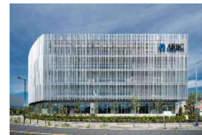
産学交流・研究開発施設（AIRBIC）