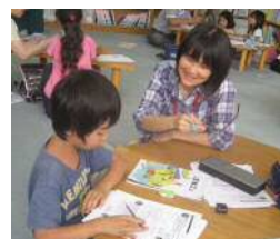
地域の寺子屋学習支援の様子