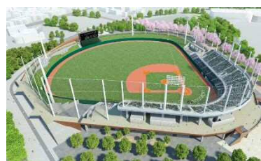
等々力硬式野球場完成イメージ