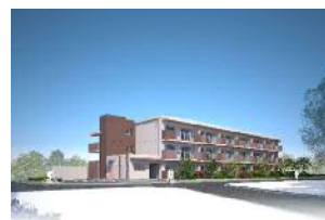
中野島住宅2号棟 完成イメージ