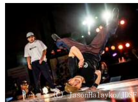
ブレイキンの様子