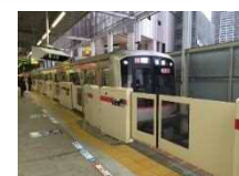
東急東横線武蔵小杉駅の ホームドア