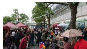
公共空間（道路）を有効活用したイベント