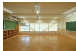
再生整備実施：御幸中学校