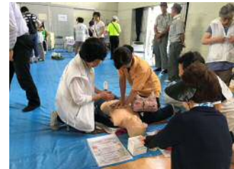
区総合防災訓練の様子