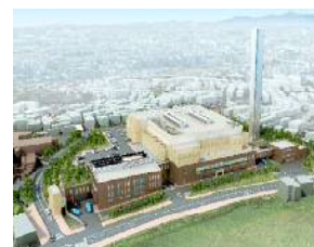
橋処理センター完成イメージ