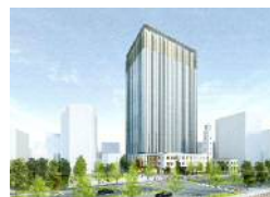
新本庁舎完成イメージ