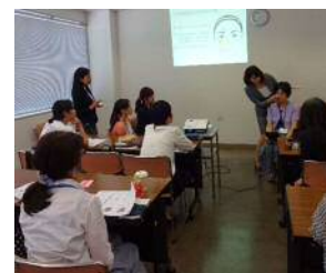
女性再就職支援事業の様子