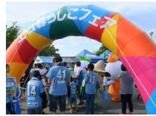
エコ暮らしこフェアの様子