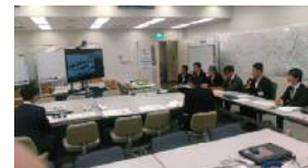
区役所企画課長会議 （テレビ会議）の様子