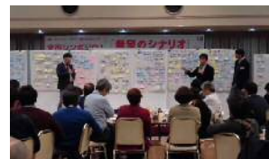
市民参加によるシンポジウム