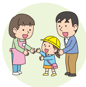
子育て支援の充実