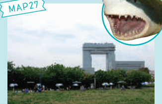
東扇島中公園(川崎マリエン)