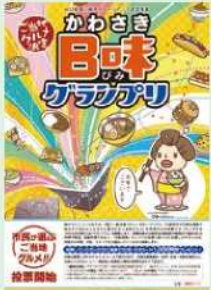
タウンニュース 「かわさき日味グランプリ」