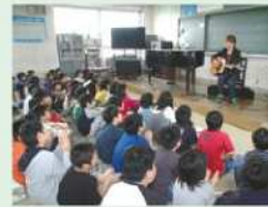
かわさきムーブアート応援隊 「こどもたちの映画作り イメージソング・キャンペーン」