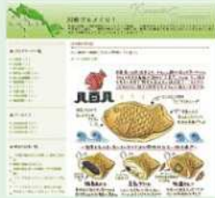
たかえみちこ イラストブログ 「かわさきグルめぐり」