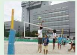
日本ビーチ文化振興協会 「かわさきHADASIビーチバレー」