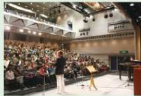
川崎ビル美装 「歌声喫茶in 川崎」