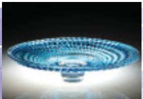
青被硝子切子皿 大本研一郎作