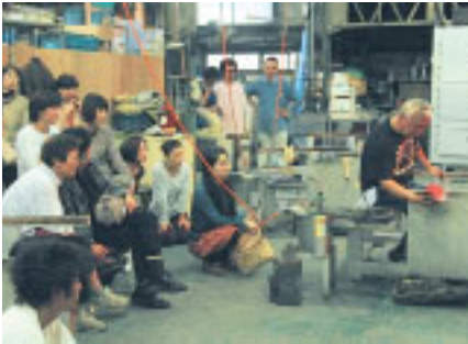
間近に見るガラス作家の技

昨年十一月、市は東京ガラス工芸研究所(川崎区)で「かわさきガラス・アート・フェスティバル」を開催しました。吹きさおに溶けたガラスを巻き付け、息を吹き込んで作る「吹きガラス」と「バーナーでガラス棒を溶かしながら丸め