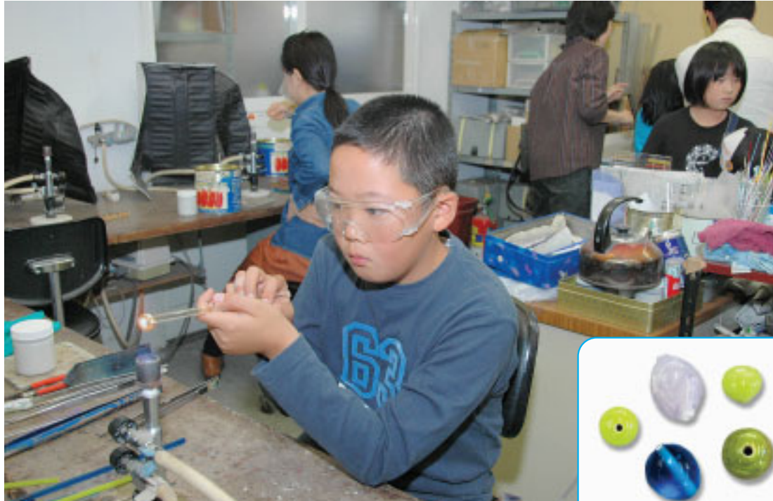
一生懸命作った、世界に1つだけのとんぼ玉

市内には東京ガラス工芸研究所をはじめ、ガラス加工・製造業者、工房・教育機関などガラス関連施設が数多くあります。市は研究所、事業者、市民と協力して、体験イベントや展覧会を開催するなど、ガラス工芸の魅力を市内外に伝えるさまざまな取り組みを行っています。