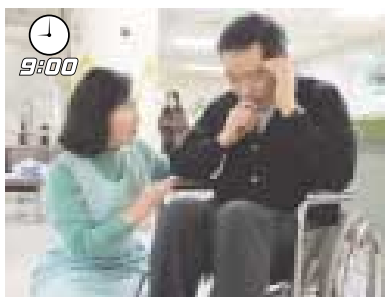
案内ボランティアが外来受け付けの手伝いをしています