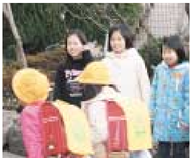
寒さに負けず元気にあいさつ

市民交流委員会ではボランティア同士の交流が深まるよう、活動報告を兼ねた交流会を年二回開催しています。また、スキルアップを目的にした研修会やボランティア参加希望者を対象にした養成講座を開催しています。ボランティアは随時募集していますので、病院までお問い合わせください。 井田病院 ☎(766)2188、☎(788)0231