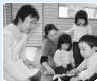
交流の輪が広がります

区では昨年から多胎児育児支援事業に取り組んでいます。ふたご育児を応援したいボランティアが集まり、「ピーナッツ」として活動を始めました。今年は次の日程でふたご育児の交流イベントを行います。併せてボランティアも募集中です。