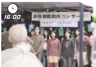
今日はイベントボランティアによる院内コンサート。井田小学校児童の歌声がロビーに響き渡りました

井田病院では、地域医療の取り組みの一つとして、ボランティアによる潤いある病院環境づくりを進めています。活動の様子やボランティアの声を紹介します。