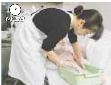
介護ボランティアが、足浴を行います