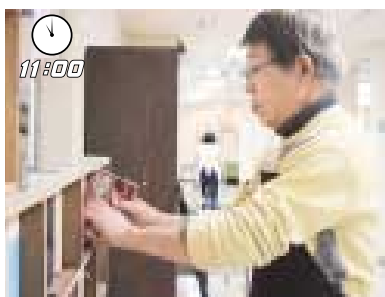
図書ボランティアが、本の貸し出しと整理に当たります