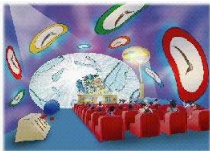
■シアター 「ここだけシアター」