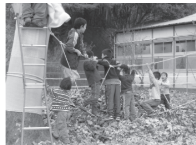
子どもの外遊びモデル事業

家族構成やライフスタイルの変化に伴い、子どもを取り巻く環境も変化してきていることから、自然環境の中で子どもの創造力を培う外遊びを提供するしくみを、地域の団体などと区役所が連携して構築していきます。