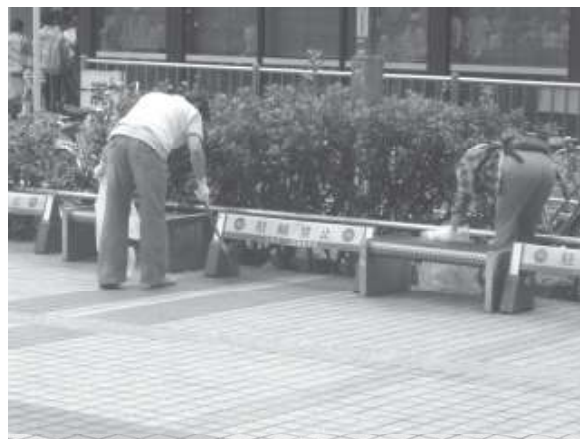
市内統一美化活動