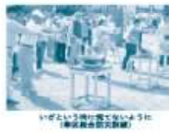
いびという関わり合いのように(尾崎区南小学校)

町内会・自治会は、地域に住む人たちが住みやすいまちを 町内会・自治会は、地域に住む人たちが住みやすいまちを