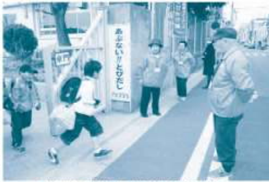
あふないりーとでじ(1)尾崎区南小学校の下校時見守り活動

暮らしやすいまちを自覚して地域の住民同士が協力し、さまざまな活動を行う町内会・自治会です。生活に身近な存在の町内会・自治会の活動を紹介します。 四市尾崎地域生活連帯会(202285、尾(2003912) 町内会・自治会は、地域に住む人たちが住みやすいまちを