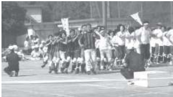
高津区親子運動会「むかで競争」