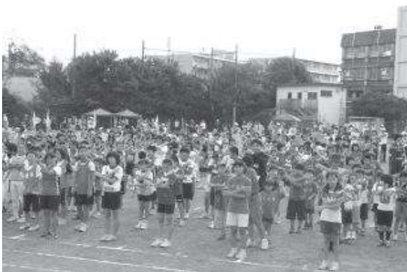
幸区リレーカーニバル「準備体操」