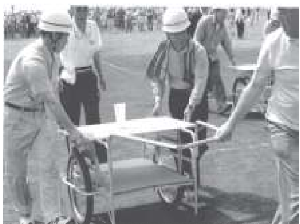
自主防災組織の活動