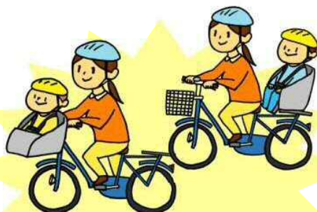
幼児用座席に小学校就学の始期に達するまでの者1人を乗車させる場合