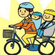
幼児用座席に小学校就学の始期に達するまでの者1人を乗車させ、幼児1人をひも等で確実に背負う場合

※抱っこひもを使用して前抱っこすると、ハンドル操作の妨げになるのでやめましょう。