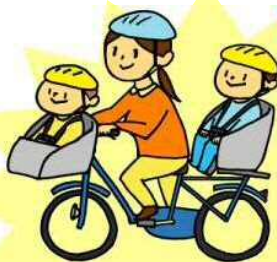
幼児二人同乗用自転車 ※1の幼児用座席に小学校就学の始期に達するまでの者2人を乗車させる場合