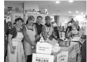
<代表者会議のブース>

10月22日、溝の口駅近くのノクティにて、多文化フェスタみぞのくちが開催されました。ハワイアンダンスや朝鮮舞踊等が披露され、沖縄や諸外国の料理が販売されたりとイベント盛り沢山の内容でした。我々代表者会議のブースでも11階のスペースの一角にて中国のえびせんべい、フィリピンのビーフン、スロバキアのグヤーシュを販売しました。朝方まで降り続いた激しい雨が心配でしたが、影響もなく、予想を超えるペースで完売できました。