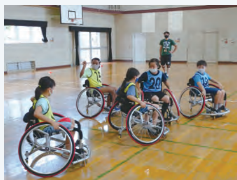
寺子屋みやまえだいら車椅子アメフト体験の様相(写真上)