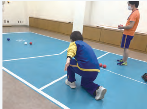
宮前スポーツセンター 🔍 検索

障害がある方も無い方も、身近な地域でスポーツに親しめるように、市内各地のスポーツセンター等でボッチャやカローリングなどの障害者スポーツ体験会が定期的開催されています。宮前スポーツセンターでは「ユニバーサルスポーツデー」の名称で開催されており、18歳以上220円、18歳未満もしくは学生110円、障害者手帳を持っている方(就学児以上)であれば無料で、どなたでも参加できます。今後の開催予定は、宮前スポーツセンターのホームページをご覧ください。