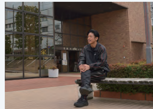
思い出の宮前区役所市民広場で(写真上)

2020年12月に開催された国際オリンピック委員会(IOC)理事会において、2024年パリオリンピック競技大会の新競技として、ダンススポーツ競技のプレイキン(ブレイクダンス)種目の追加が正式に決定いたしました。