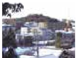
有馬神明神社からは、有馬の街並みや有馬ふるさと公園を一望できる

★ 華西国稲毛三十三ヶ所観音霊場第12番札所。健武4年(1337)銘の板碑がある。