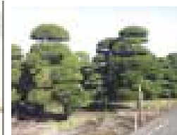
つげ・もみじの里

★ 華西国稲毛三十三ヶ所観音霊場第12番札所。健武4年(1337)銘の板碑がある。