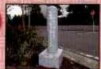
① 町田川・南河原水分岐点 道標