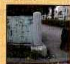
● 古市場 古多摩川流路跡 道標