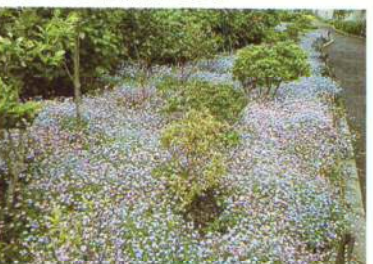
忘れな草の咲き揃う中丸子南緑道

渋川（シブッカ）を暗渠にした緑道です。地域の人達の努力で一年中花の絶えない公園となり、初夏に群れ咲くアジサイも見事です。玉川小学校の児童達による壁の絵も楽しい、やすらぎの場所です。