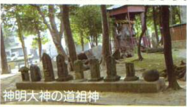
神明大神の道祖神

神明大神は、羽黒権現として明暦2(1656)年に建立し、明治に神明大神となりました。双体の道祖神等14像が裏手に並んでおり、中丸子を開いた歴史を偲ぶことができます。