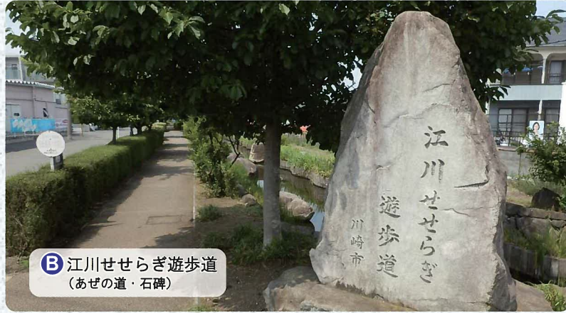
B 江川せせらぎ遊歩道 (あぜの道・石碑)

四季折々の景観を味わいながら、高津区と中原区の区境をのんびり歩いてみてはいかがでしょうか。