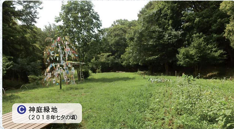
C 神庭緑地 (2018年七夕の頃)