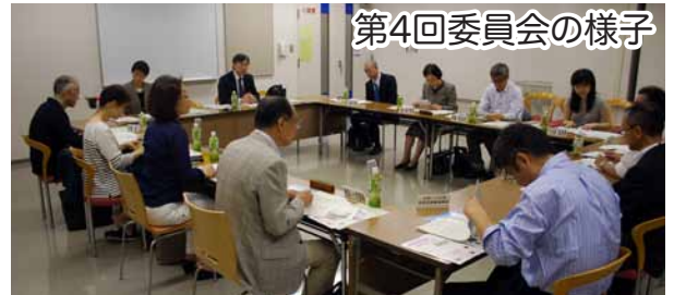
第4回委員会の様子

第4回川崎市協働・連携のあり方検討委員会が平成27年5月1日、高津市民館第1・2会議室(ノクティ2 高津区溝口)で開催され、中間支援組織の役割と協働・連携の仕組みづくり、協働・連携を生み出す情報施策の2つのテーマについて、討議しました。