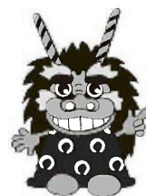
川崎市文化財保護推進キャラクター シッシー君