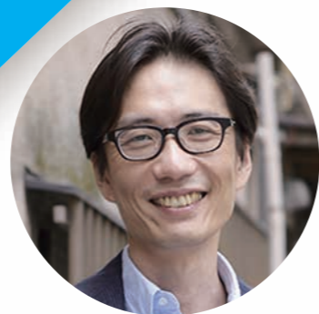
社会活動家、東京大学 先端科学技術研究センター 湯浅誠 特任教授