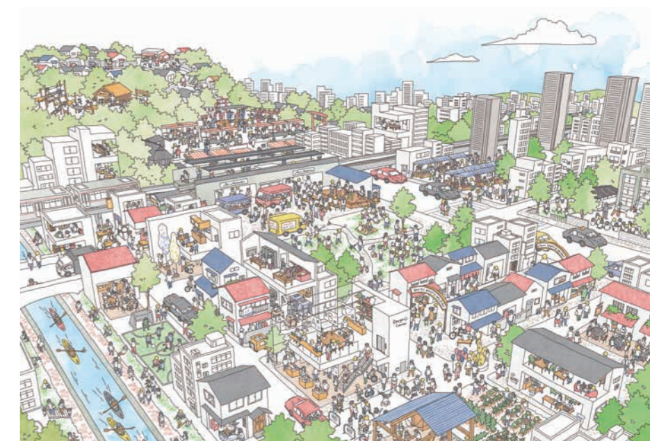
イラスト：イスナデザイン