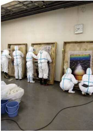
引き出しに固着した作品を一枚ずつはがす作業