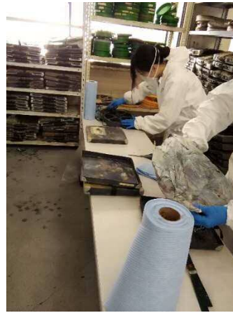
映像フィルムの簡易洗浄