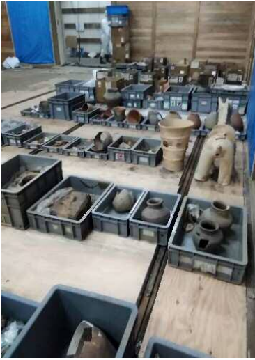
第2 収蔵庫から運び出した考古資料