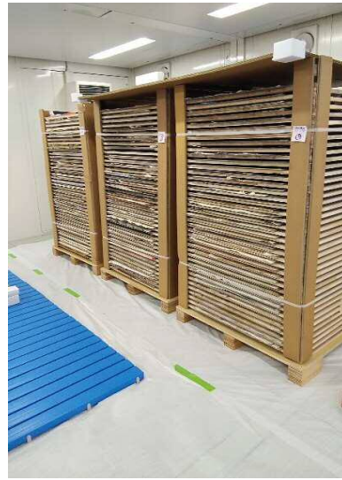
燻蒸が終わった作品の保管（ユニットハウス内）