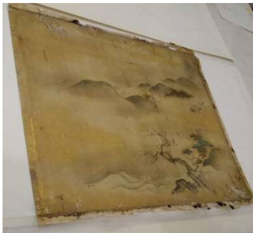
写真7 市重要歴史記念物「古筆手鑑「披香殿」」 修復前（合本状態）