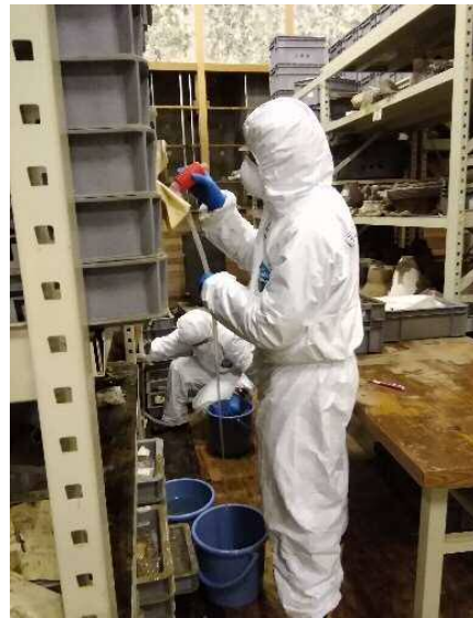
コンテナからの水抜き作業