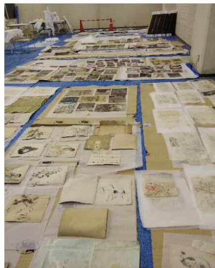
画稿を一枚ずつはがして乾燥させている状態