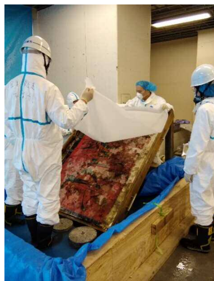
グラフィックの引き出しをプールにいれて作品を取り出すところ