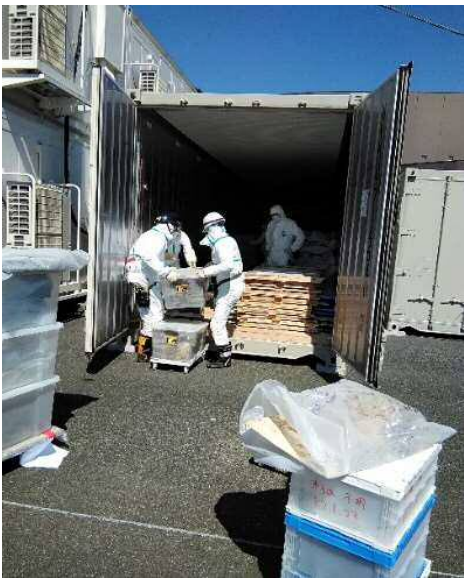
冷凍コンテナに搬入