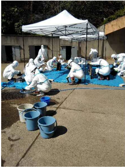
民具を洗浄する様子