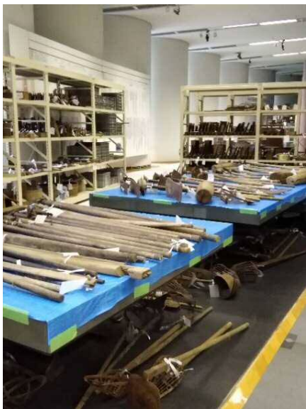
洗浄後、常設展示室内に置かれた民具