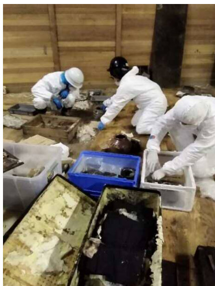
作品を確認しながら収蔵庫から移動するための梱包作業